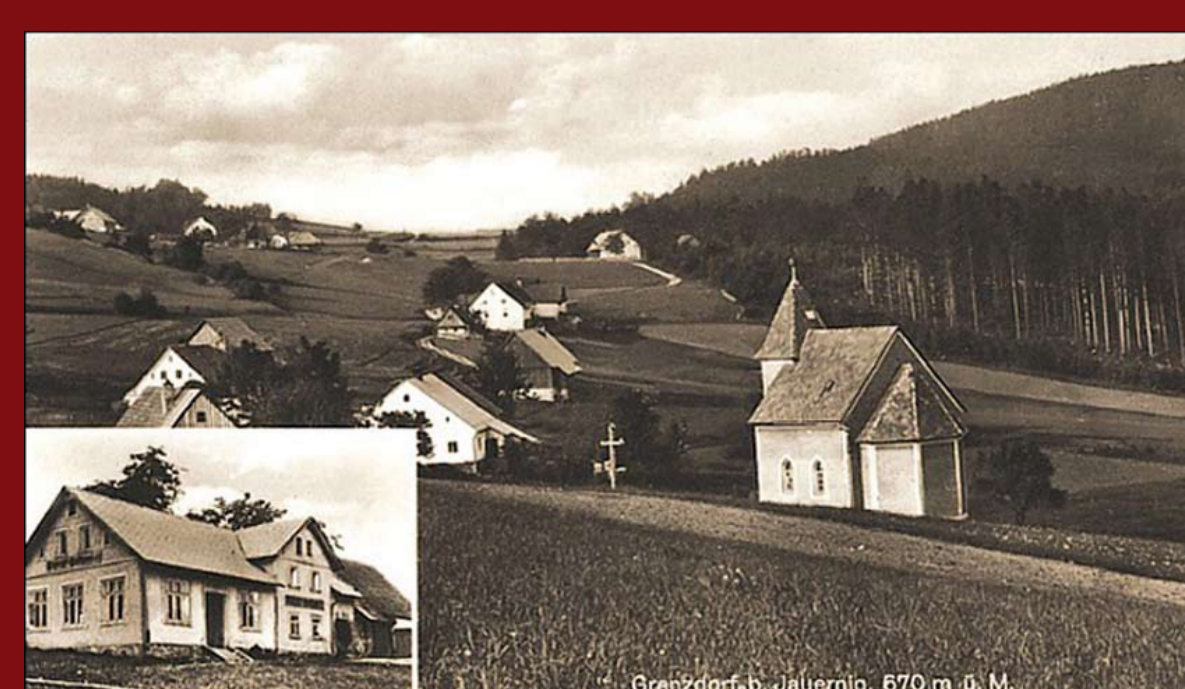
Celkový pohled a hospoda/ Panorama i gospoda