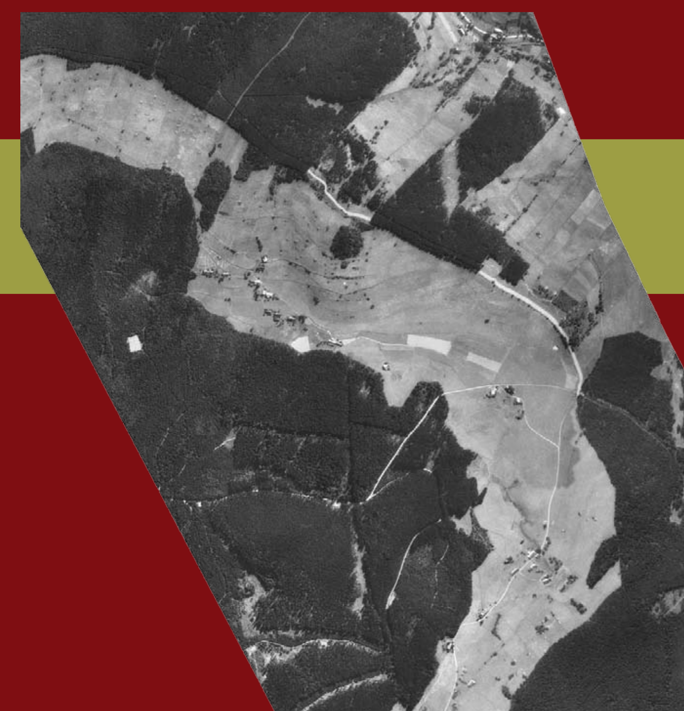
Letecký snímek z roku 1953 zdroj: VGHMÚř Dobruška