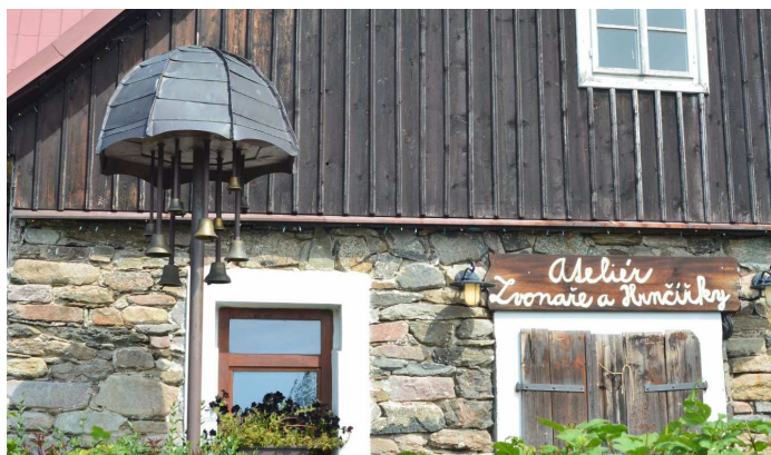
Parasol – jak przystało na Deszczowe...