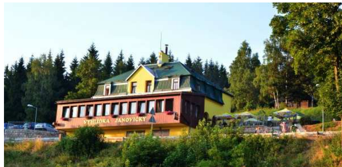
Widokowa restauracja w Janovickách

Ogniska nie ma w planie – z braku czasu i odpowiedniego miejsca a także z powodu suszy i zakazu (park krajozawczy).