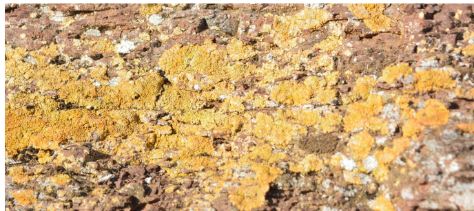
W Wąwozie Rožmítalskim

Ogniska nie ma w planie – z braku czasu i odpowiedniego miejsca a także z powodu suszy i zakazu (park krajoobrazowy).