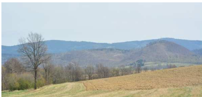
Pątnik w północnej połowie tysy