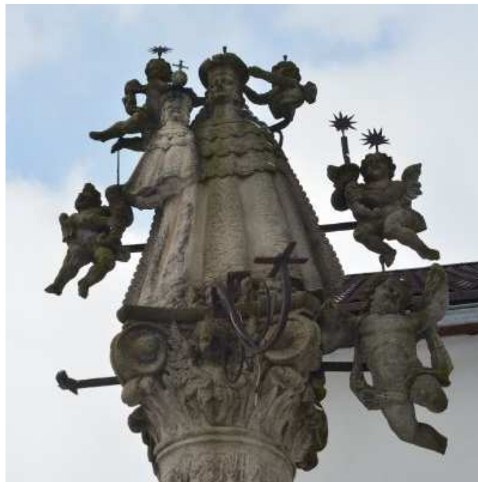
Rozanielona Matka Boska Śnieżna

kwitnący czosnek niedźwiedzi (taki powinniśmy zastosować aromaterapeutycznie)