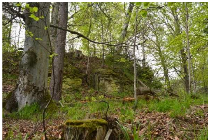
Południowy wierzchołek Mnicha

Zdjęcie na pierwszej stronie: Mniszki na tle Mnicha