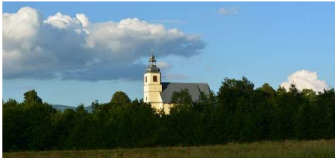
Kościół w Boboszowie