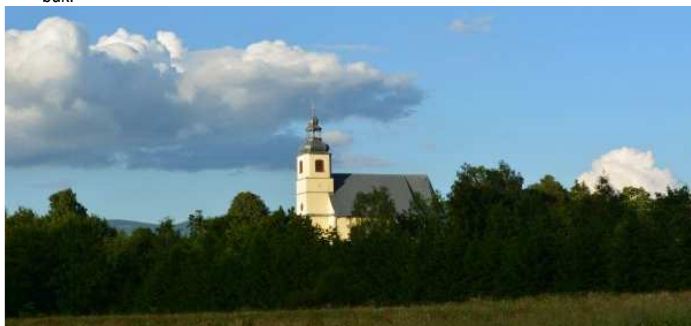
Kościół w Boboszowie