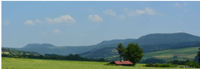
Widok z Bezdiekowa na Szczelińce i Skalniak

Parking niestrzeżony i darmowy. To otoczony murkiem placik przed dawną strażnicą Wojsk Ochrony Pogranicza. Pojazdy proszę stawiać oszczędnie. Można blokować się nawzajem, przecież i tak dotrzemy na metę razem. Wyruszymy od razu. Kto się spóźni – dogania.