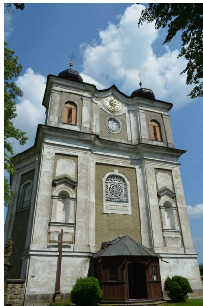
Kościół pw. św. Prokopa w Bezdiekowie

Zamiast ogniska tym razem proponujemy koncert w kościele w Bezdiekowie. Wstęp płatny 'co laska' w dowolnej walucie – do skarbonek przed wejściem.