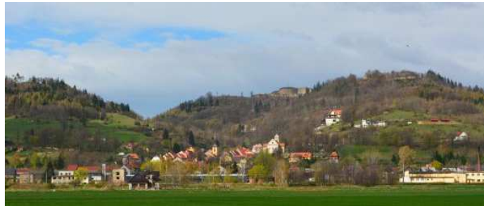
Widok z Przedgórza Sudeckiego na Srebrną Górę

Musimy zachować tam szczególną ostrożność!