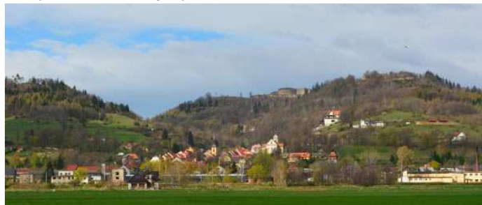
Widok z Przedgórza Sudeckiego na Srebrną Górę

Część naszej trasy będzie wieść odcinkami bardzo wąskich, krętych, stromych i wzbogaconych o przeszkody ścieżek rowerowych, po których z dużą prędkością mogą poruszać się rowerzyści. Oni mają tam pierwszeństwo i należy spokojnie schodzić im z drogi, pamiętając również o własnym bezpieczeństwie. Odcinki te są dobrze oznakowane i zostaną po drodze dodatkowo zasygnalizowane. Musimy zachować tam szczególną ostrożność!