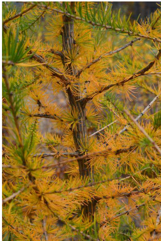
Wszyscy, których kocham, wita was modrzewia ikona złocista...