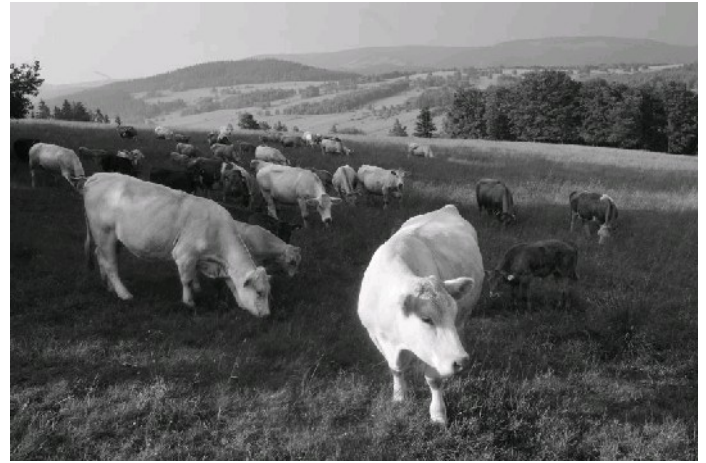
Krowy wysokogórskie (prawie 750 m n.p.m.)

Chętni mogą wydrukować swoje miejscówki i położyć w kościelnych ławkach przed wyjściem na trasę.