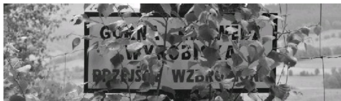
Nieczynny kamieniołom melafiru nad Świerkami

Šonov – U Farářů – Vysoká skála – Przełęcz pod Słoneczną Kopą – skraj kamieniołomu – Czarna (Mez) – Głowy – Wysoka – Włodarz – Homole – Šonov