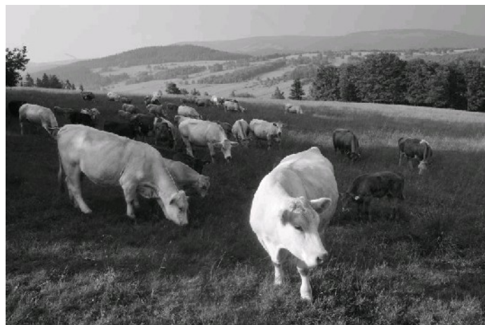
Krowy wysokogórskie (prawie 750 m n.p.m.)

Chętni mogą wydrukować swoje miejscówki i położyć w kościelnych ławkach przed wyjściem na trasę.