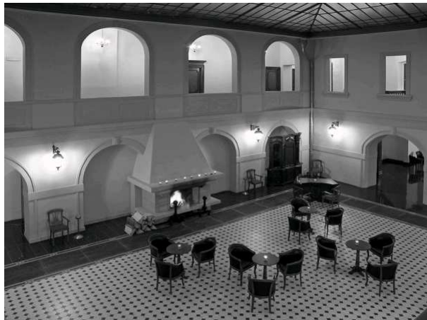
Zadaszony dziedzińiec pałacu w Trzebieszowicach

Zwiedzanie z przewodnikiem jest płatne 15 PLN od osoby i trwa od 40 do 60 minut. Na trasie można zagrać w pałacową grę terenową. Kto nie chce zwiedzać pałacu, pije kawę lub je ciacho w kawiarni na krytym dziedzińcu. Zgłoszenia chętnych i wpłaty u organizatorów na starcie wycieczki. Jeśli chętnych będzie wielu, na zwiedzanie zostaną wysłane dwie grupy.