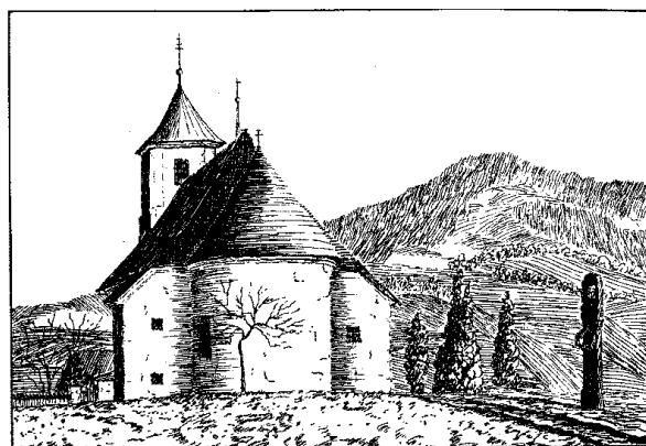
Kościół i kapliczka pokutna w Ponikwie (Guda Obend 1935)