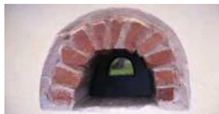
Widok przez kapliczkę w Ponikwie

W planie jest ognisko – pod koniec trasy, w porze obiadowej. Wycieczkę zakończymy po godzinie 16:00 w centrum Bystrzycy. Pociąg na północ odjeżdża o 18:25, autobus – około 18:00.