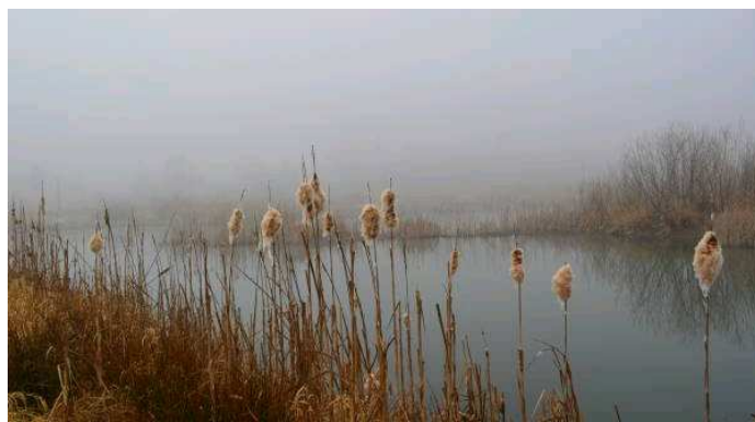
Palka wodna – również przedwiosenna