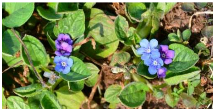
Ułudka wiosenna (przedwiosenna) kwitnąca

Wycieczkę zakończymy około godziny 18:00 czyli tuż przed odjazdem pociągu na południe. Pociąg na północ jest pół godziny później.