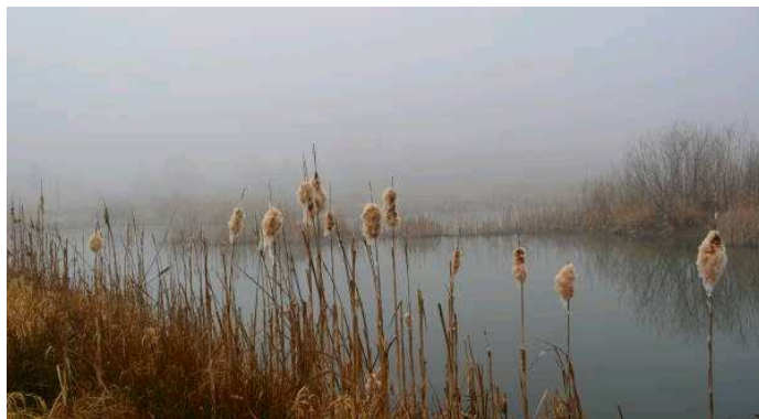
Palka wodna – również przedwiosenna