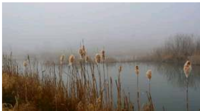
Palka wodna – również przedwiosenna