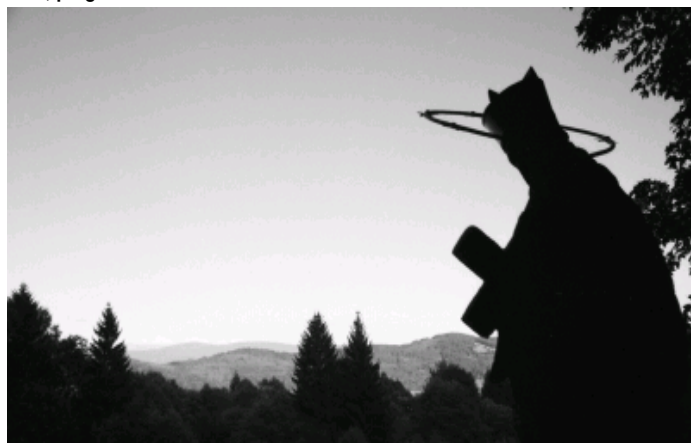
W górnym Neratowie

Wycieczkę zakończymy w miejscu startu o zmierzchu lub nocą tego samego dnia, po godzinie 20:00.