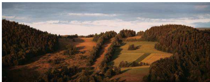
Nad Konradowem. Tędy być może będziemy schodzić...

Wycieczkę zakończymy w miejscu startu po południu tego samego dnia, raczej po godzinie 18:00.