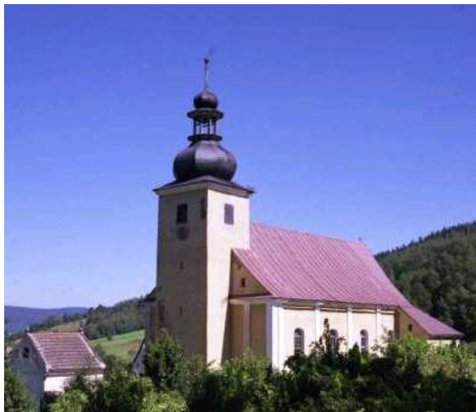
Kościół Podwyższenia Krzyża Świętego w Konradowie

Parking (miejsca postojowe przy sklepie, remizie strażackiej, placu rekreacyjnym i poniżej kościoła) jest niestrzeżony i darmowy. Pojazdy proszę stawiać oszczędnie.