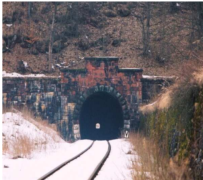
Start jest z drugiej strony

Na pierwszej stronie: taśmociąg Świerki – Wyrębina (pod prąd)