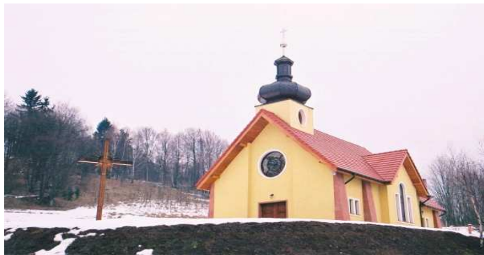
Nowa kaplica w Wyrębinie

Trasy wycieczek ODKRYWANIE OKOLICY raczej omijają szlaki turystyczne, unikają dróg asfaltowych – lepiej chodzi się po ścieżkach i drogach leśnych lub po łąkach, a nawet torem kolejowym – nie stronią od rozległych widoków, miejsc urokliwych i ciekawostek krajoznawczych. Bywa, że dla urozmaicenia lub skrótu droga wiedzie przez chaszczę lub na przykład torem kolejowym.