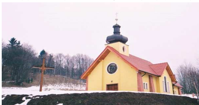
Nowa kaplica w Wyrębinie