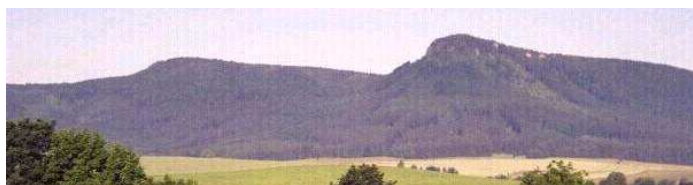
Powyżej Korona, na pierwszej stronie: Guzowata.

(tam między innymi opis trasy z mapką oraz wspomnienia z poprzednich wycieczek)