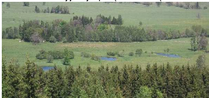
Bedřichovka: stawy sztucznie przywrócone naturze

Samochody jak zwykle proszę ustawiać oszczędnie.