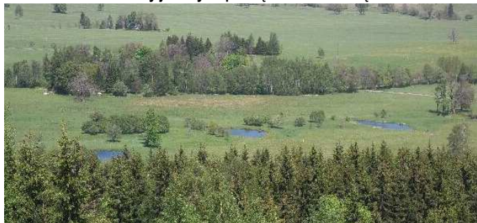
Bedřichovka: stawy sztucznie przywrócone naturze

Samochody jak zwykle proszę ustawiać oszczędnie.