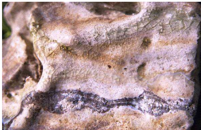
Skarby szklarskie z Hutniczej Łąki

Ogniska w planie nie ma, ale na mecie chętni mogą je sobie zorganizować sami.