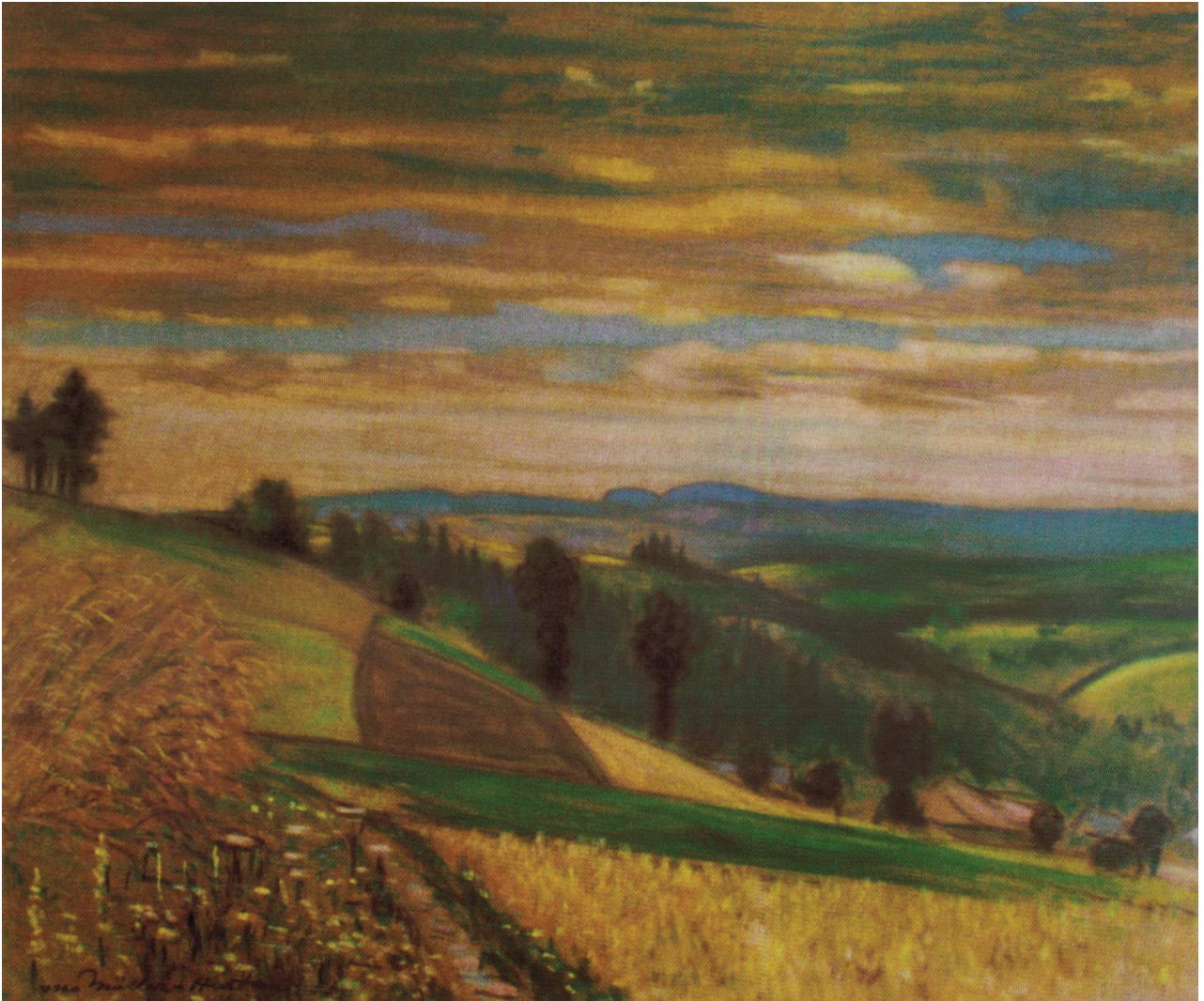
Widok na Szczeliniec Wielki w Górach Stołowych