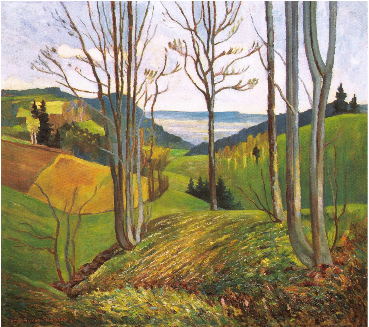
Widok z Gór Orlickich w stronę Dusznik Zdroju

Otto Müller (1898-1969), malarz – pejzażysta, postugiwał się przydomkiem 'Hartau'. W latach 1930-1946 mieszkał w Podgórzu.