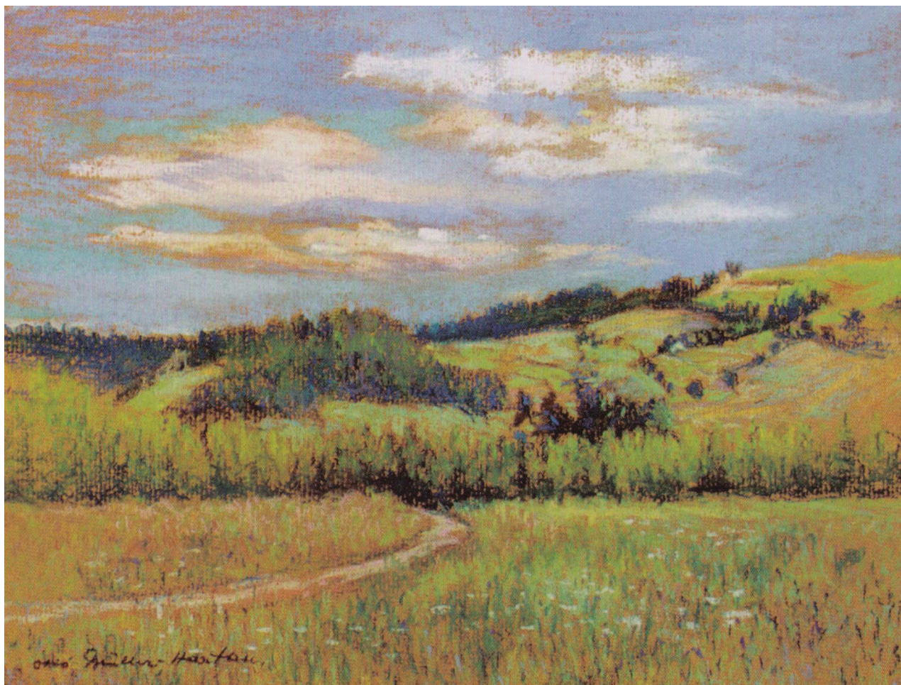
Fragment Gór Orlickich ze skocznia narciarską na skraju lasu