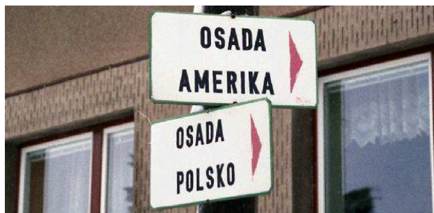
Dobrošov: Amerika tu, Polska tam

Dojazd własnym sposobem, na przykład samochodami. Zalecamy oczywiście niemarnowanie w nich miejsc i obsadzanie każdego wolnego kolejnym uczestnikiem wspólnego wędrowania.