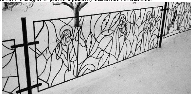
Dobrošov – sceny biblijne na ogrodzeniu kościołka

Po pierwsze: po drodze będzie i Polska, i Amerika, i Piekło. A do tego jeszcze Zapiekło! Po drugie: w 'piekle' będziemy startować i finiszować.