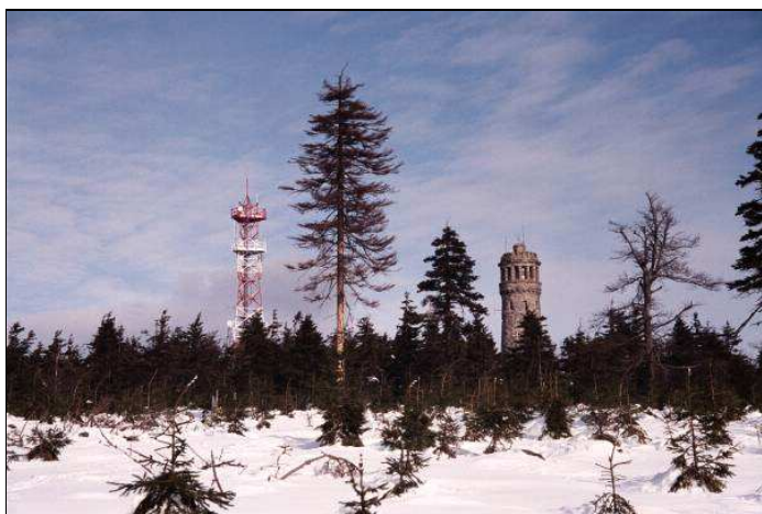
Wieża na Wielkiej Sowie (widok nieaktualny)