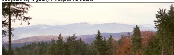
Widok sprzed 'Orla': najwyższe szczyty Gór Kamiennych

Rozwiązanie tej zagadki zostanie ujawnione na wycieczce. Póki co swoje pomysły proszę nadsyłać pocztą elektroniczną na wiadomy adres do czwartku, 17. marca 2011 włącznie (czyli do końca czwartku). Za prawidłowe rozwiązania przewiduje się przyznanie skromnych nagród, których wręczenie odbędzie się w godnym miejscu na trasie.