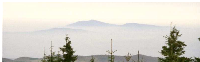
Widok z Wielkiej Sowy: Ślęża z przyległościami

(tam między innymi opis trasy z mapką oraz wspomnienia z poprzednich wycieczek)