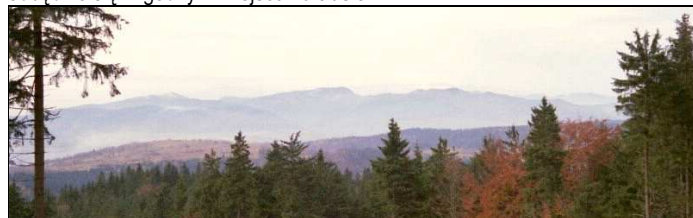
Widok sprzed 'Orla': najwyższe szczyty Gór Kamiennych

Rozwiązanie tej zagadki zostanie ujawnione na wycieczce. Póki co swoje pomysły proszę nadsyłać pocztą elektroniczną na wiadomy adres do czwartku, 17. marca 2011 włącznie (czyli do końca czwartku). Za prawidłowe rozwiązania przewiduje się przyznanie skromnych nagród, których wręczenie odbędzie się w godnym miejscu na trasie.