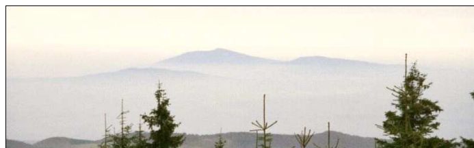
Widok z Wielkiej Sowy: Ślęza z przyległościami

Dojazd własnym sposobem, na przykład samochodami. Zalecamy oczywiście niemarnowanie w nich miejsc i obsadzanie każdego wolnego kolejnym uczestnikiem wspólnego wędrowania. Na dojazd na Przełęcz Walimską samochodem z Bystrzycy Kłodzkiej najlepiej zarezerwować przynajmniej 100 minut. Najszybsza i chyba najmniej dziurawa droga dojazdowa wiedzie obwodnicą Nowej Rudy, przez Jugów, Sokolec i Walim.