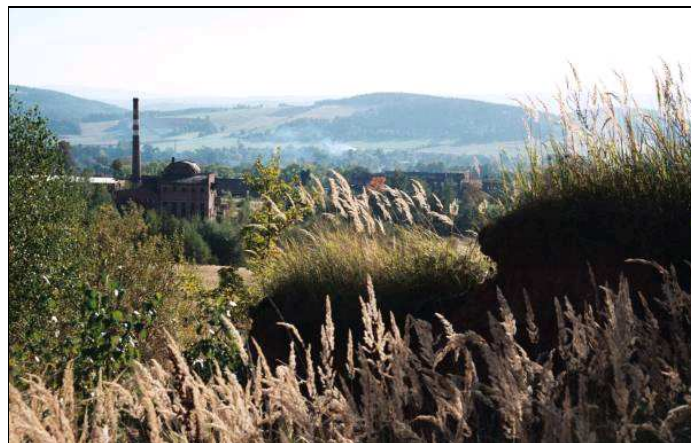
Ścinawka Średnia – widok z wyrobiska dawnej cegielni

Ruda – tak na Nową Rudę mówi wielu mieszkańców tego miasta i najbliższych mu okolic, zwłaszcza mieszkańców Stupca i Drogostawia, które ktoś kiedyś postanowił do Nowej Rudy włączyć. Ruda to właściwie Poręba, ale już za późno na prostowanie tego spolszczenia. Rude w pełni jesieni powinny być niektóre elementy krajobrazu po drodze.