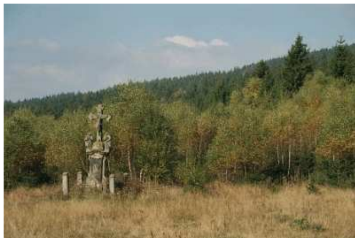
Ukrzyżowanie – najlepiej zachowany obiekt w Heidelbergu