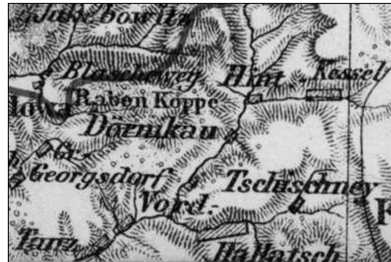
Na niektórych mapach z 2. połowy XIX w. Darnków dzielony był na Przedni i Tylny.