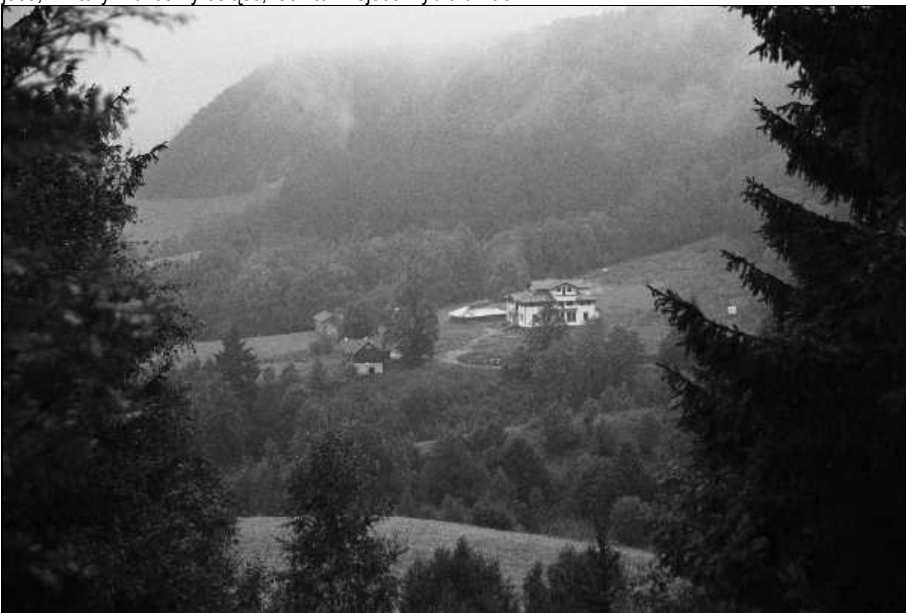
klasztor Drophan Ling Związku Buddyjskiego Khordong w Darnkowie

Dlaczego w Darnkowie? Rzec by można przypadek, ale mówimy tak wtedy, gdy nie znamy przyczyn. Natomiast każde zjawisko ma swoją przyczynę. Darnków, jak i cała Ziemia Kłodzka, jest miejscem pięknym, spokojnym, magicznym. I - co zadziwiająco - bardzo podobnym do miejsca położonego w Tybecie, gdzie dawno temu został zbudowany pierwszy Klasztor Khordong. Czasami zresztą mam wrażenie, że to nie my wybieramy miejsce, w którym chcemy osiąść, lecz to miejsce wybiera nas".