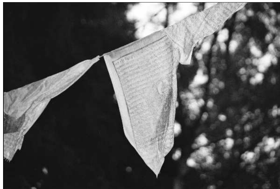
flaga modlitewna z mantrą zapisaną pismem devanagari

Wraz z budową klasztoru Khordong i centrum odosobnień w Darnkowie stworzono miejsce, gdzie cała sangha europejska może praktykować zgodnie z naukami Padmasambhawy, a tradycja Khordong może być rozwijana w Europie. Miejsce, gdzie można organizować regularne odosobnienia i spotkania z nauczycielami buddyzmu tybetańskiego, gdzie możliwa jest praktyka grupowa i indywidualna. Miejsce, gdzie mogą mieszkać praktykujący, gdzie tłumaczy się, wydaje i przechowuje buddyjskie teksty.