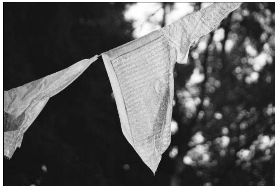
flaga modlitewna z mantrą zapisaną pismem devanagari

Wraz z budową klasztoru Khordong i centrum odosobnień w Darnkowie stworzono miejsce, gdzie cała sangha europejska może praktykować zgodnie z naukami Padmasambhawy, a tradycja Khordong może być rozwijana w Europie. Miejsce, gdzie można organizować regularne odosobnienia i spotkania z nauczycielami buddyzmu tybetańskiego, gdzie możliwa jest praktyka grupowa i indywidualna. Miejsce, gdzie mogą mieszkać praktykujący, gdzie tłumaczy się, wydaje i przechowuje buddyjskie teksty.