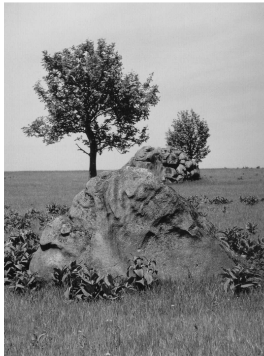
Skalki Łężyckie wiosną

Powrót pociągiem Kudowa Zdrój – Kłodzko Główne, który z Lewina odjeżdża o 17:37. Przyjazd jego do Polanicy powinien nastąpić o 18:49, a do Kłodzka o 19:15.